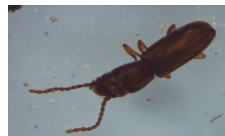
Flat grain beetle ( Cryptolestes spp.)