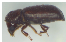
Lesser grain beetle ( Rhyzopertha dominica F.)