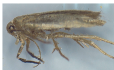
Angoumois grain moth ( Sitotroga cerealella (Olivier))