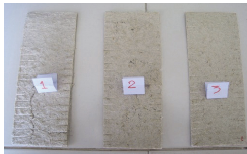
Figure 1 Pieces of rice straw paper (1) 6 mm thickness (2) 4 mm thickness (3) 2 mm thickness

นำฟางข้าวจากฟาร์มมหาวิทยาลัยเทคโนโลยีสุรนารีมาทำการย่อยด้วยเครื่องสับลดขนาดให้ได้ขนาดเล็กกว่า 3 มม. จากนั้นนำฟางข้าวที่เตรียมได้จำนวน 200 กรัม ลงต้มในหม้อต้มเยื่อที่บรรจุสารละลาย NaOH ความเข้มข้น 4 เปอร์เซ็นต์โดย ปริมาตร (ธนพรธน และคณะ, 2545) เป็นเวลา 1 ชั่วโมง จากนั้นทำการล้างเยื่อด้วยน้ำสะอาด แล้วทำการเกลี่ยเยื่อบนตะแกรง ขนาด 40x 60 ซม. จากนั้นนำไปตากแดดเมื่อแห้งจะได้กระดาษฟางข้าวที่มีความหนา 2 มม. สำหรับกระดาษฟางข้าวที่ความ หนา 4 และ 6 มม. ทำการเตรียมเช่นเดียวกันแต่เพิ่มปริมาณฟางสับเป็น 300 และ 400 กรัม ตามลำดับ นำกระดาษที่ได้มาตัด เป็นแผ่นสี่เหลี่ยมขนาด 8x24 ซม. แล้วกรีดเป็นริ้วตามลักษณะดังแสดงใน Figure 1.