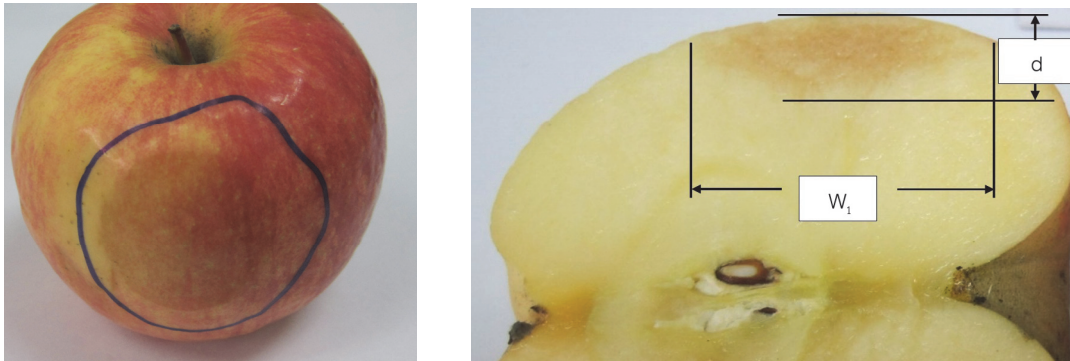
Figure 2 Bruise on apple fruit and dimension of measure.

โดยที่ E คือพลังงานตกกระทบ (จูล), m คือมวลของผลแอปเปิ้ล (กก.), g คือความเร่งเนื่องจากแรงโน้มถ่วง (เมตร/วินาที 2 ), h คือระยะความสูงที่ผลแอปเปิ้ลตก (เมตร)