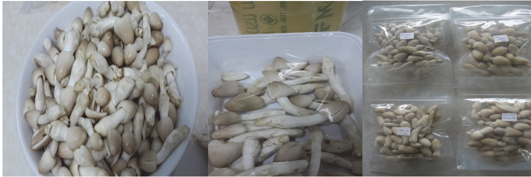
Figure 1 Coprinus mushrooms were harvested and divided into treatments : not cooled, or hydro-cooled by dipping in cold water at 5 and 10°C for 5 minutes before being over-wrapped with polyvinyl chloride (PVC) film or packed in polyethylene (PE) bags.