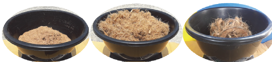
Figure 3 Coir dust, fibres and residue

Note: *The different alphabet in the same column represent DMRT with 95% statistically significant.