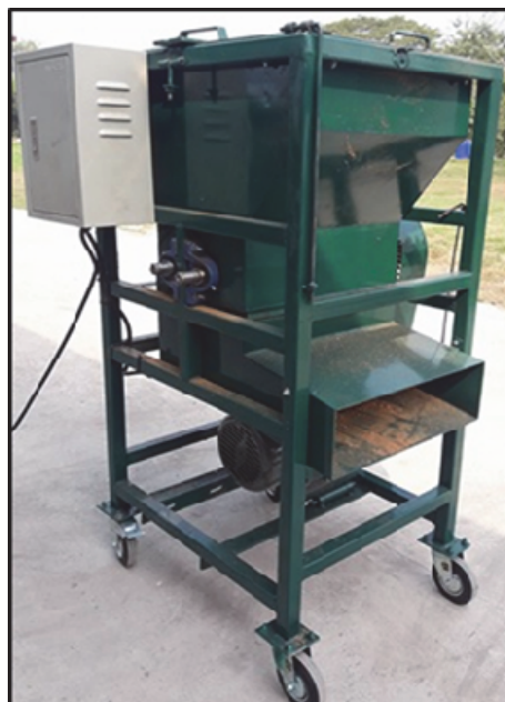
Figure 2 Coconut husk shredding machine

ข้อมูลลักษณะทางกายภาพของเปลือกมะพร้าวแก่นำมาใช้ประกอบการออกแบบและสร้างเครื่องย่อยเปลือกมะพร้าว มีส่วนประกอบสำคัญ 5 ส่วนหลัก ได้แก่ โครงเครื่อง ชุดใบมีดสับย่อย มอเตอร์ไฟฟ้า ช่องป้อนเปลือกมะพร้าว และช่องออกของขุยและใยมะพร้าว ดัง Figure 2