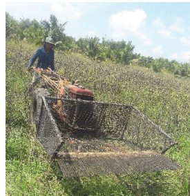
Figure 8 Harvesting machine of farmer