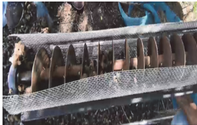
Figure 4 Test the thresher and clean the Rough cocklebur

14.17 กิโลกรัมต่อไร่ คิดเป็นอัตราส่วนโดยน้ำหนัก 94.02% และ 5.98% ตามลำดับ (Table 2) ผลการวิเคราะห์ด้านเศรษฐศาสตร์วิศวกรรมของเครื่องเกี่ยวนวดกระชับต้นแบบมีต้นทุนค่าใช้จ่าย 326.5 บาท/ไร่ มีจุดคุ้มทุนเมื่อทำงาน 211.2 ไร่ และระยะเวลาคืนทุนประมาณ 3 ปี (Table 1) ส่วนวิธีการของเกษตรกรที่ใช้ในปัจจุบัน จะใช้เครื่องเกี่ยวที่ผลิตเอง (Figure 8) ซึ่งได้ผลการทดสอบแสดงใน Table 1 และ Table 2 จากนั้นนำเมล็ดกระชับมาทำความสะอาดอีกขั้นตอนหนึ่ง (Figure 9) ซึ่งวิธีการของเกษตรกรมีต้นทุนค่าใช้จ่าย 1,750 บาท/ไร่ (รวมต้นทุนการนวดและทำความสะอาด) มีจุดคุ้มทุนเมื่อทำงาน 126 ไร่ และระยะเวลาคืนทุนประมาณ 2 ปี (Table 1)