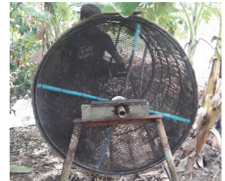
Figure 9 Cleaning process of farmer