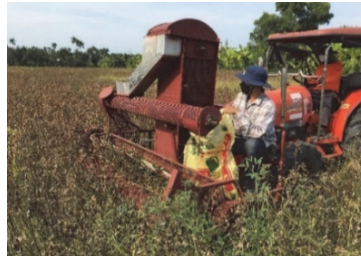
Figure 5 Testing the prototype in the farmer